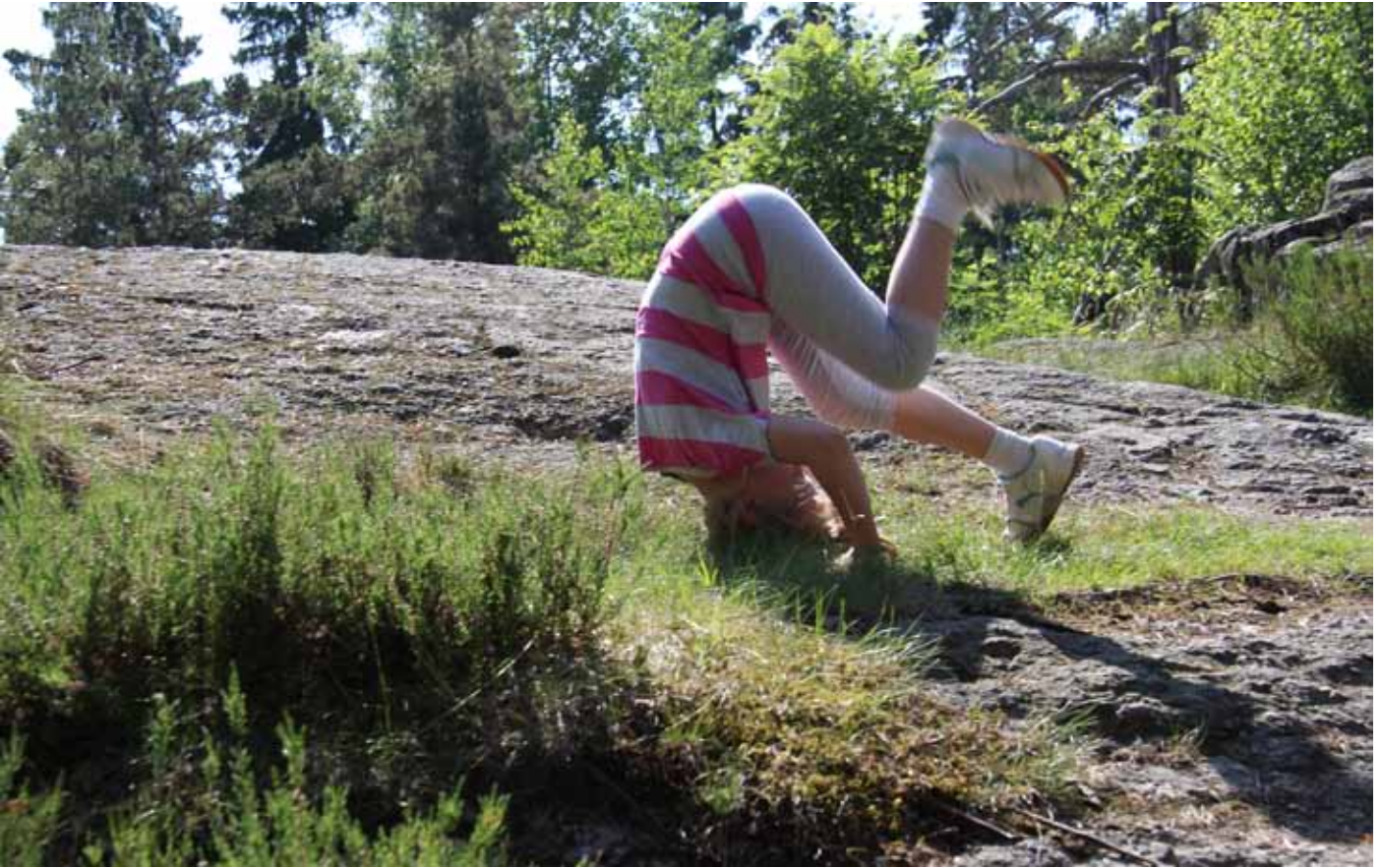
Suomen Ladun lasten ja perheiden toiminta painottuu alle 10-vuotiaisiin lapsiin.