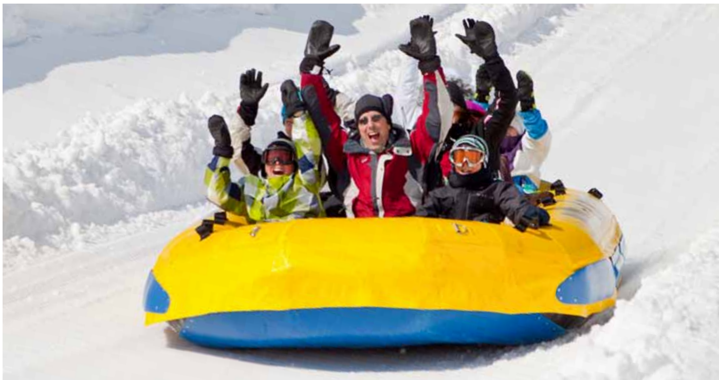
Uusia ulkoilutapoja maailmalta.