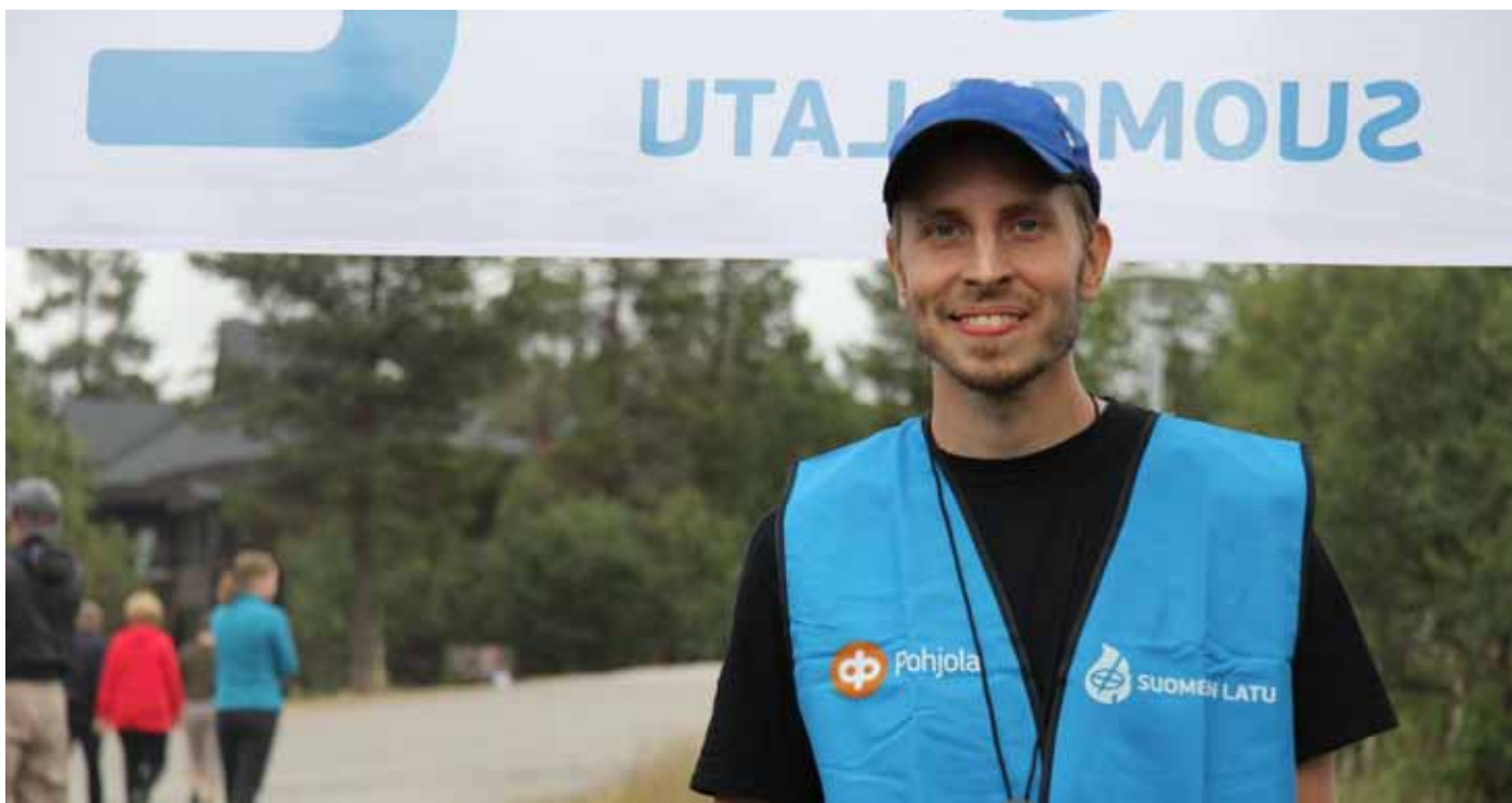
Suomen Latu palvelee jäsenyhdistyksiään monin tavoin.