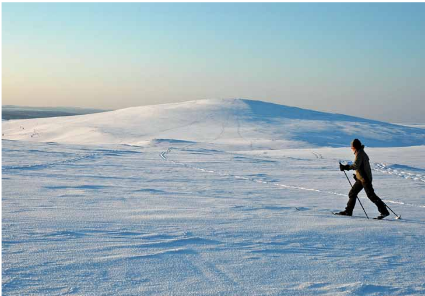
Latu & Polku -lehdessä esitellään laajasti hiihto- ja retkeilymahdollisuuksia kotimaassa ja ulkomaisilla.

tysaktiiveille perustetaan oma Facebook-ryhmä.