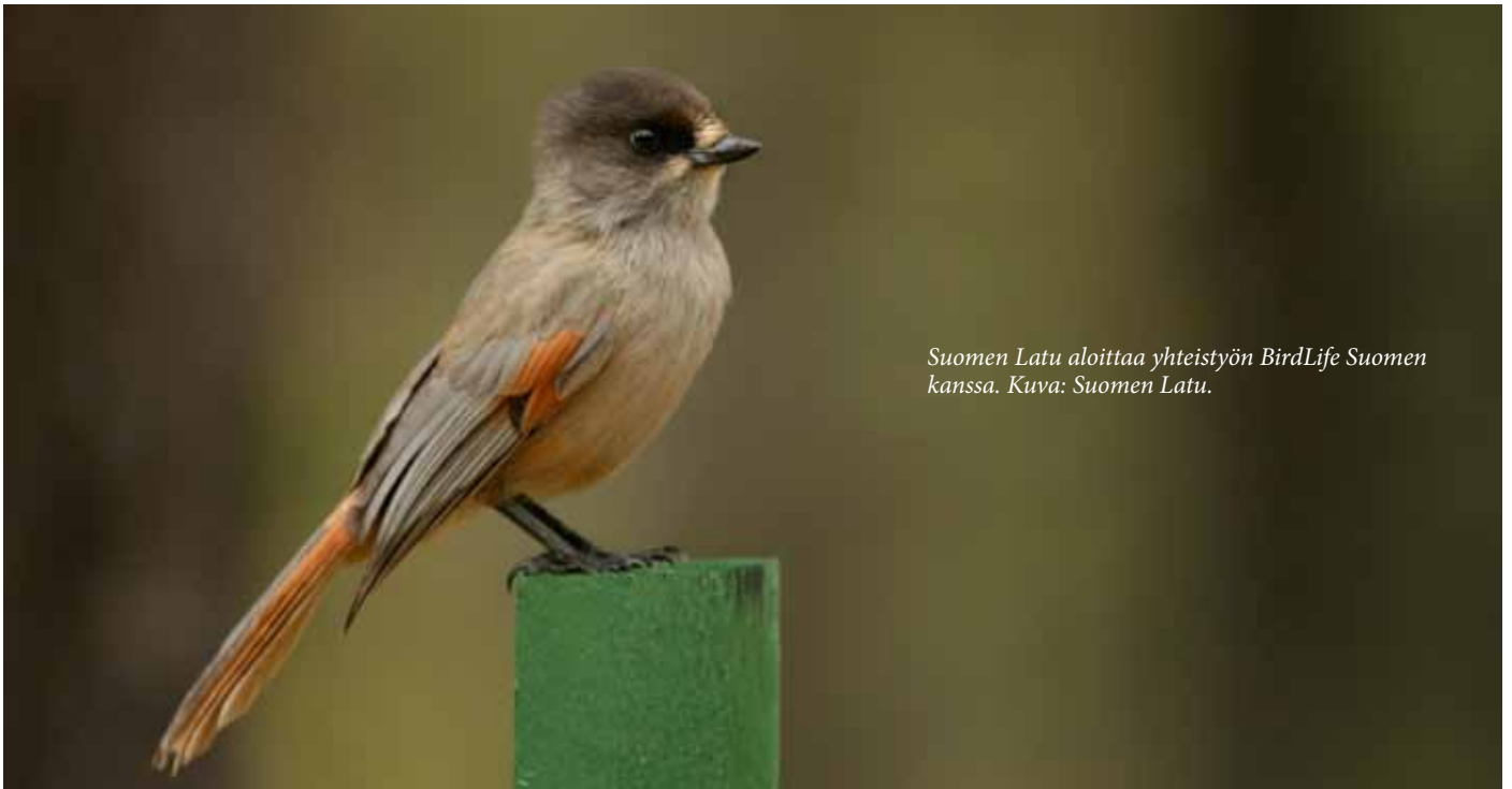
Suomen Latu aloittaa yhteistyön BirdLife Suomen kanssa.

UKK-instituutti tuottaa terveystuotteen tutkimuksia, joiden tuloksia hyödynnetään Suomen Ladun toiminnassa.