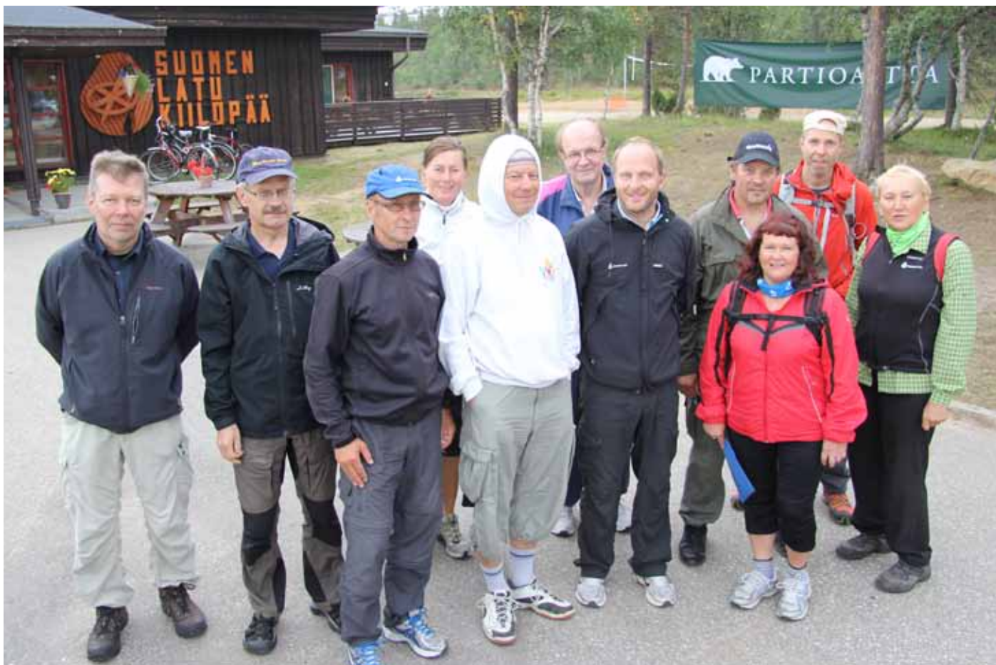
Suomen Ladun hallitus 2013.

Suomen Ladun uutta strategiaa vuosille 2016–21 työstetään kevät- ja syysliitokokousten yhteydessä. Hallitus vastaa strategiatyöstä. Toimikunnat, alueet sekä henkilökunta osallistuvat strategian suunnitteluun. Prosessi toteutetaan päivittämällä nykyistä hyväksi havaittua strategiaa, joka pohjautuu jäsenistön tahotilaan ja näkemykseen Suomen Ladun visiosta.