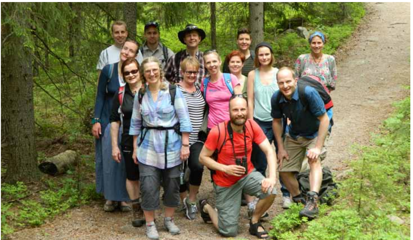
Suomen Ladun toimiston väki kesällä 2013.

Järjestötoimikunta Lasten ja nuorten toimikunta Sääntötoimikunta Talviuintitoimikunta ”Ulkoilun pyöreä pöytä”