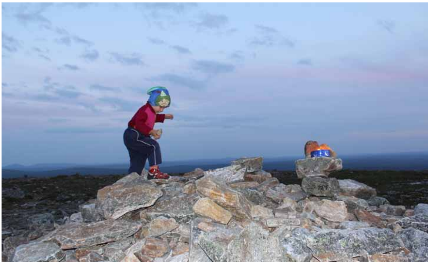
Suomen Latu Kiilopää panostaa perheiden palveluihin.

teena. Yhteistyössä aluemarkkinointiyhtiön kanssa pidetään matkanjärjestäjävierailuja ja workshopeja, osallistutaan alueen markkinointitapahtumiin ja ollaan mukana markkinointityöryhmässä.