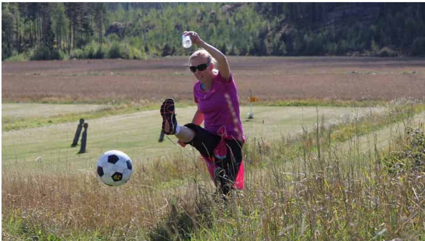
Jalkapallogolf on uusi liikuntalaji maailmalta.

tarjotaan sauvakävelyn ohjaajakoulutusta liikunnanohjaajaopiskelijoille.